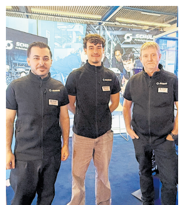
Der Messeauftritt von Schuler Präzisionstechnik.

Auf der Suche nach Azubis? In der Ausbildungsbörse eintragen und erfolgreich finden: www.hwk-konstanz.de/ausbildungsbörse