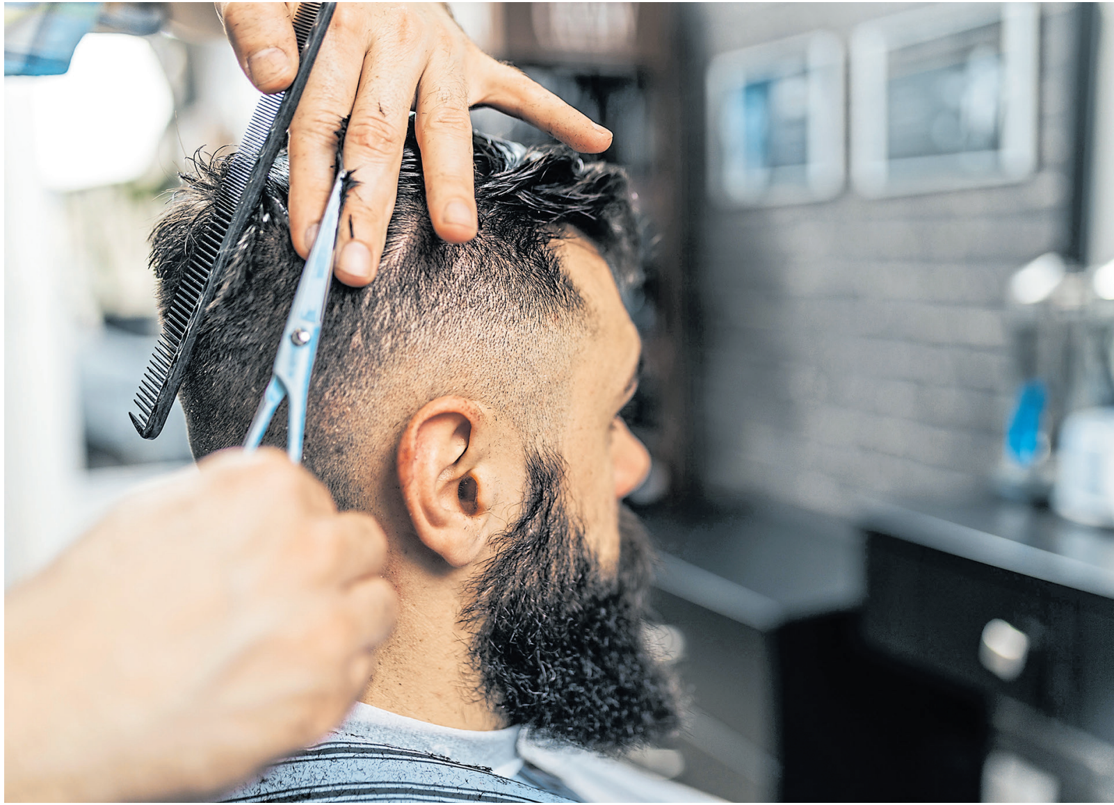
Die Handwerkskammer Konstanz geht gegen nicht eingetragene Handwerksbetriebe vor, darunter sind zahlreiche Babershops (Symbolbild).