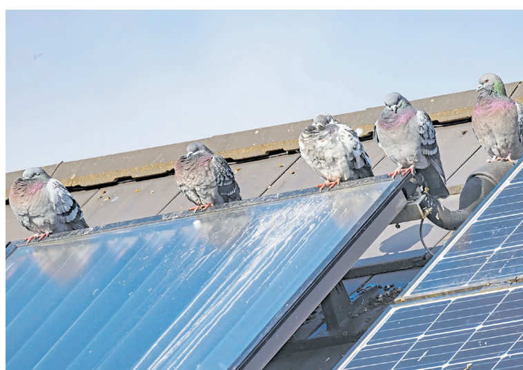
Unter Solaranlagen finden Tauben Nistplätze. Das sollte bei der Installation mitgedacht werden, um Probleme zu vermeiden.

„Bei der Kundschaft werden Taubenschutzmaßnahmen zunehmend ein Thema und wir bieten das auch mit an. Allerdings denkt der Kunde wirtschaftlich und will seine Solaranlage möglichst kostengünstig aufs Dach bringen“, so Klinkenberg. Die Systeme seien aber in den vergangenen Jahren deutlich günstiger geworden. Nach Angaben des PV-Fachmanns wird der Taubenschutz aktuell bei rund zehn Prozent der Neuinstallationen direkt mit angebracht, abhängig