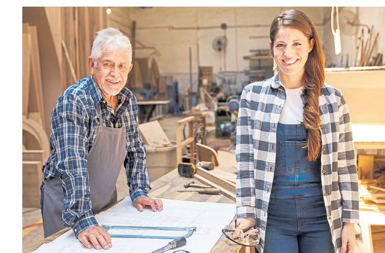
Übergabe an die nächste Generation: Viele Handwerksbetriebe suchen einen Nachfolger.